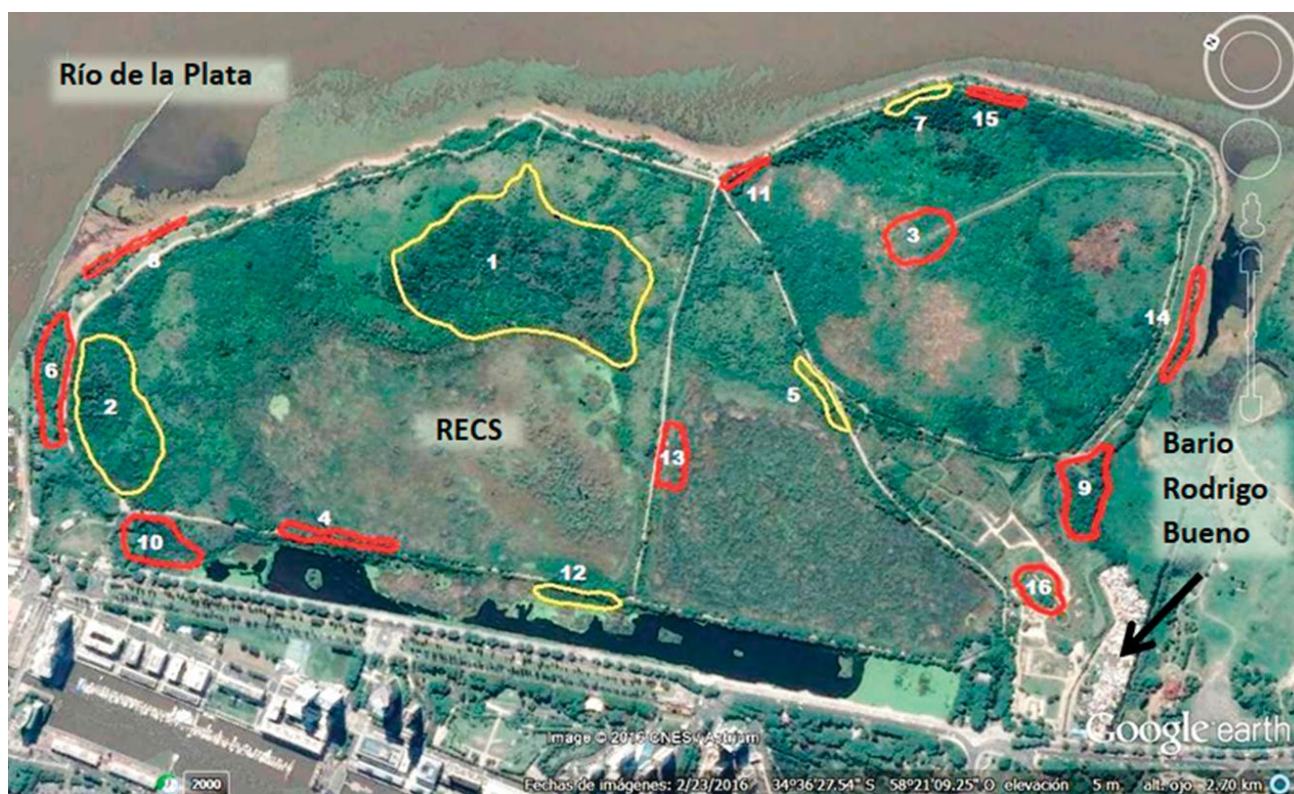
Figura 1. Ubicación geográfica de las áreas de muestreo y clasificación según tipo de área. Contorno rojo: área degradada, transectas 3, 4, 6, 8, 9, 10, 11, 13, 14, 15, 16. Contorno amarillo: área conservada, transectas 1, 2, 5, 7, 12. Se marca con una flecha la ubicación del barrio Rodrigo Bueno.